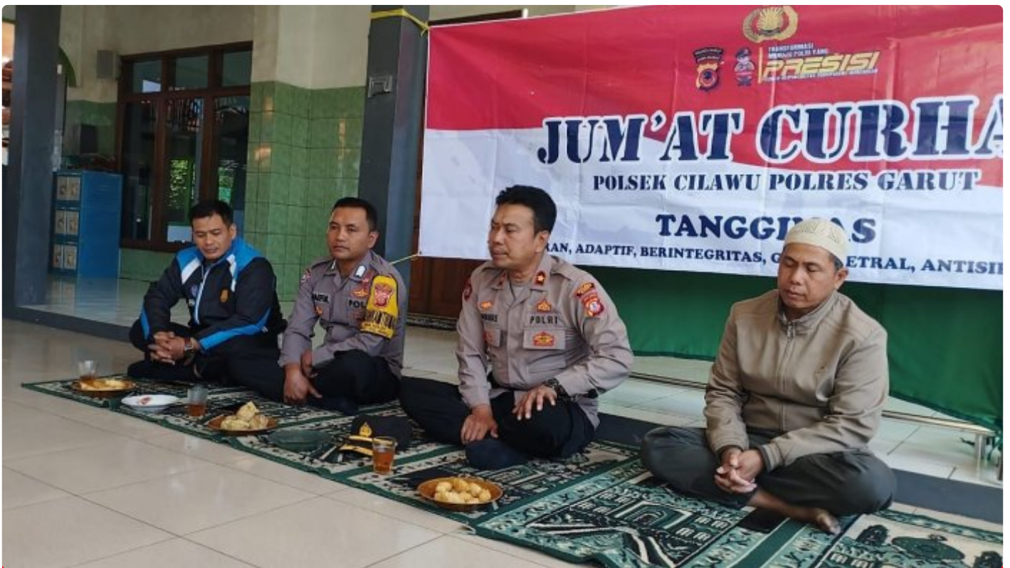
Kapolsek Cilawu mendengarkan curhatan warga